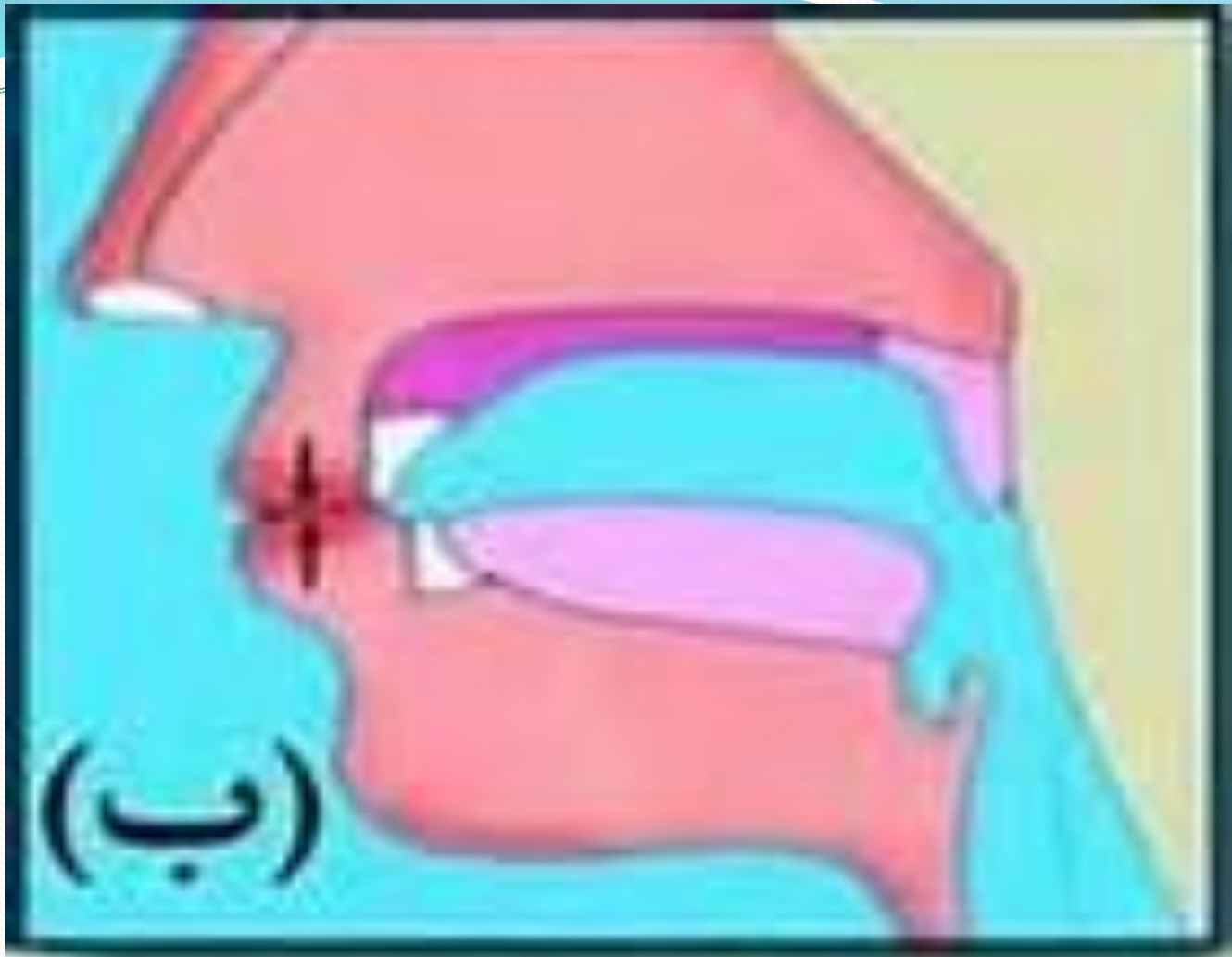
بالطباق أهد للفتين